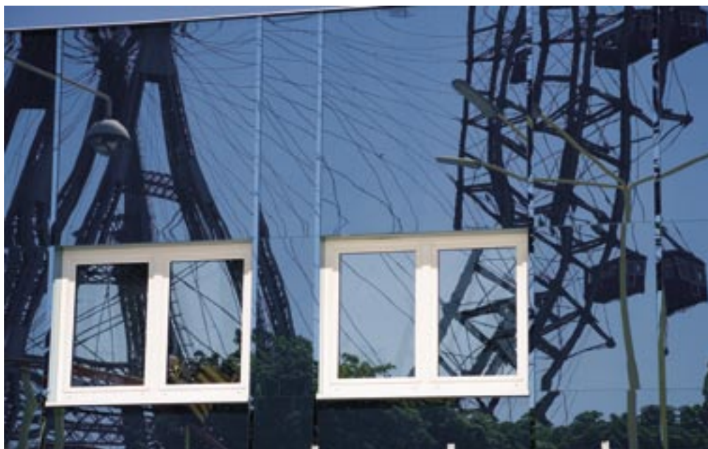
Riesenrad. 620.000 Menschen jährlich genießen vom Riesenrad, dem Wahrzeichen der Prater, aus die Sicht über Wien. 1897 erbaut, 65 Meter hoch, gilt es nicht nur als Touristenattraktion, auch für Filmproduzenten ist es ein beliebtes Motiv. Nach einem Brand 1944 wurde das Riesenrad ein Jahr später wieder aufgebaut. 2002 kehrten acht der verschollenen Waggon zurück und seit diesem Jahr leuchtet das Riesenrad nachts in goldenem und silbernem Licht. ( www.wienerriesenrad.com )